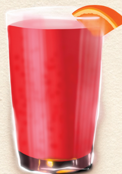
Jus de Fruits