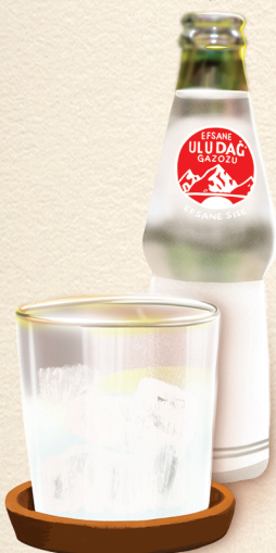
Ulu Dağ Gazoz