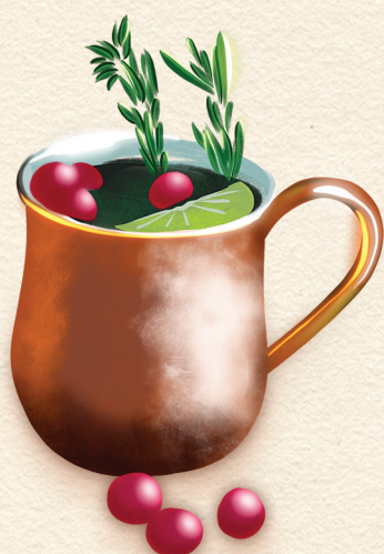
Québec Mule des Fêtes