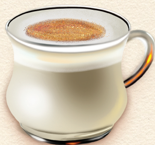
Lait de Poule